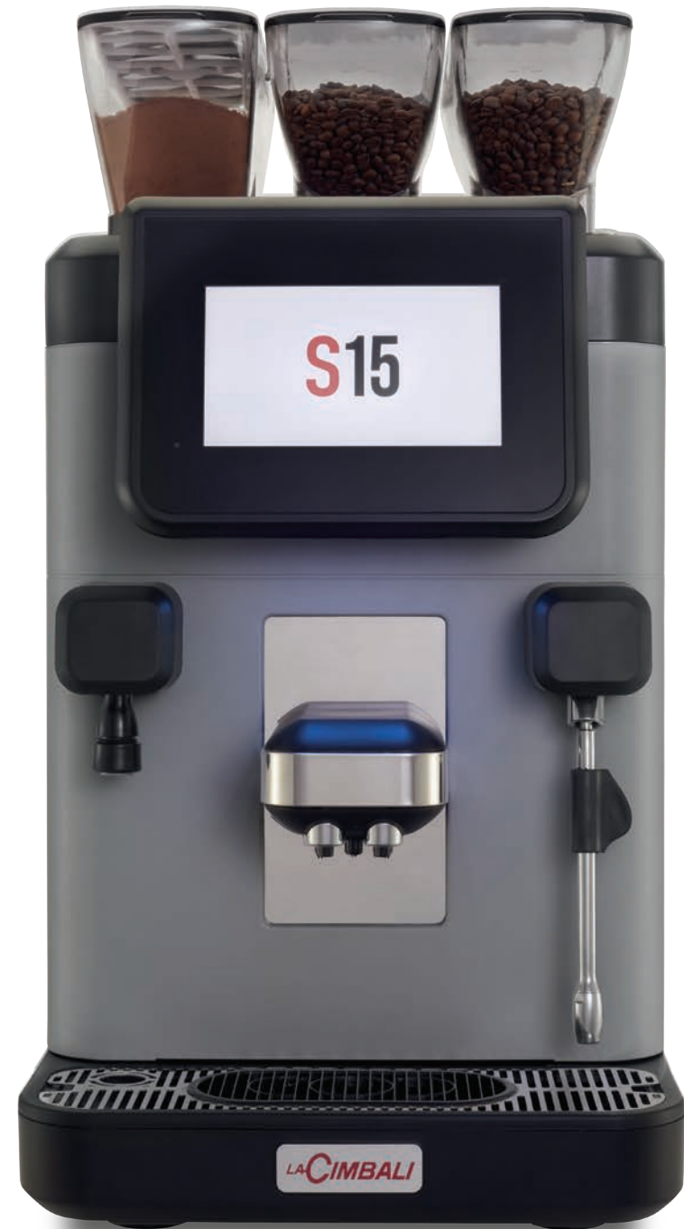
LaCimbali S15 – Vorderseite und ¾ Vorderansicht